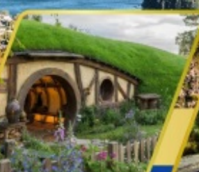
บ้านฮอบบิต อาหารแบบ BBQ