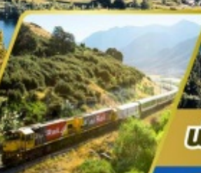
นั้รตไฟฟราชนิ อิลไฟนิ