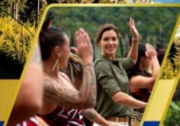
หมู่บ้านเมารี อาหารสโตล์ฮอกเมารี แบบแฉ่ง