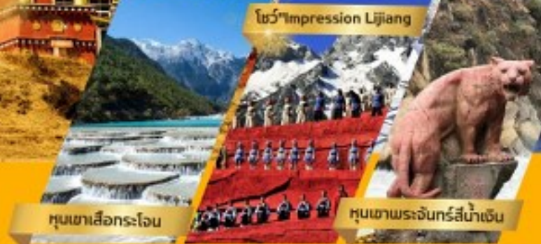
หุบเขาเสือกระโจน