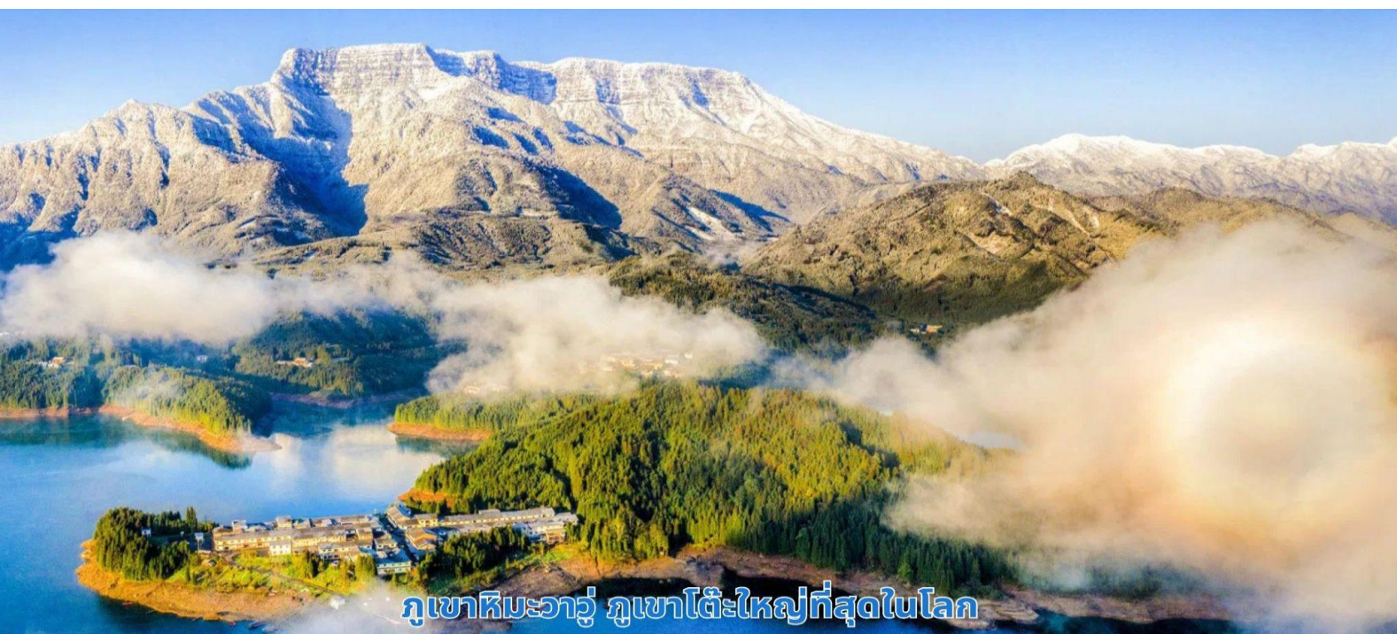
ภูเขาหิมะวาวู ภูเขาโต๊ะใหญ่ที่สุดในโลก