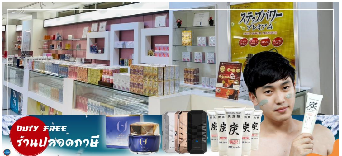
DUTY FREE ร้านปลอดภาษี

จากนั้นเดินทางสู่ เมืองอาซาฮิคาว่า (Asahikawa) (ใช้เวลาเดินทางประมาณ 2.30 ชั่วโมง) เป็นเมืองใหญ่อันดับ 2 ของจังหวัดซอกไกโด รองจากเมืองซัปโปโร เป็นเมืองศูนย์กลางทางตอนเหนือของเกาะ ล้อมรอบด้วยเทือกเขาไดเซ็ตสึชันและแม่น้ำน้อยใหญ่ มีแหล่งท่องเที่ยวยอดนิยมอยู่หลายแห่ง