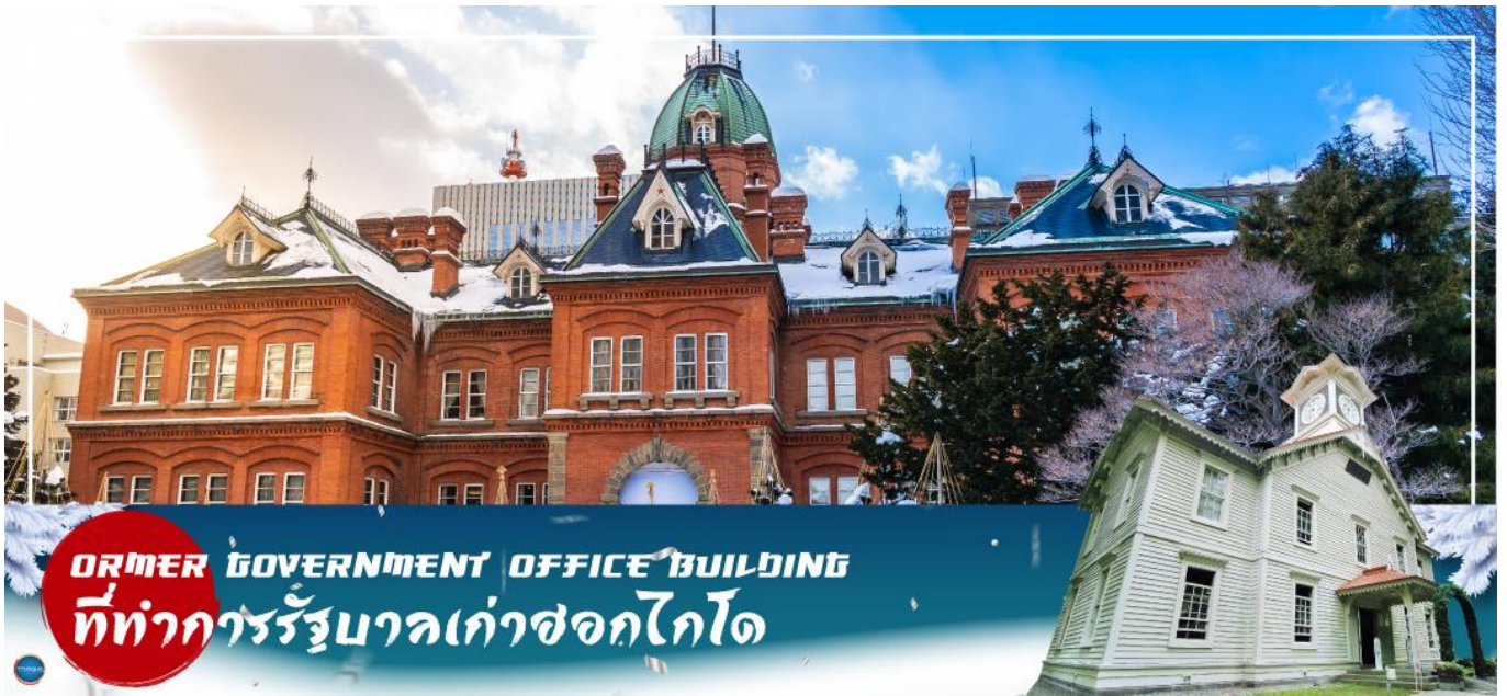
FORMER GOVERNMENT OFFICE BUILDING ที่ทำการรัฐบาลเก่าซอกไกโด

วันที่สี่ เมืองซัปโปโร – ดิวตี้ฟรี – ผ่านชม ศาลาว่าการเมืองซอกไกโดหลังเก่า – ผ่านชม หอนาฬิกาเมืองซัปโปโร – เมืองอาซาฮิคาว่า– โซยุเคียว – ภูเขาคุโรดาเกะ (นั่งกระเช้า)**ขึ้นอยู่กับสภาพอากาศ** – ออนเซน