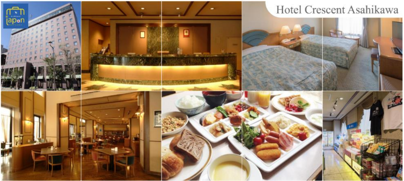
Hotel Crescent Asahikawa

รับประทานอาหารเย็น ณ ภัตตาคาร (10) HOTEL CRESCENT ASAHIKAWA หรือเทียบเท่าระดับเดียวกัน