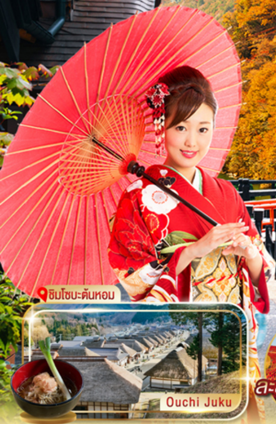
ชิมโซะ-ตันหอม

ชูปตาร์...กินชชิน ออนเซ็น ใม่เปลี่ยนสีในหุบเขาที่เจียบสง