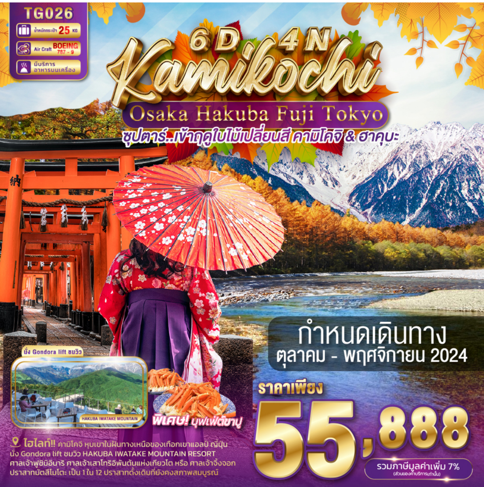
นั่ง Gondora lift ชมวิว

ซูปราร์..เจ้าฤดูใบไม้เปลี่ยนสี คาซึโคจิ & ฮาคุบะ