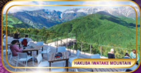
HAKUBA IWATAKE MOUNTAIN