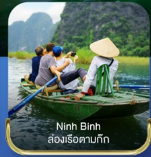
Ninh Binh ล่องเรือตามก๊ก