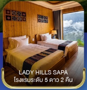
LADY HILLS SAPA โรงแรมระดับ 5 ดาว 2 คืน