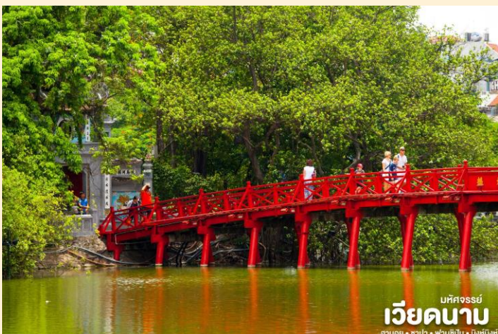
มณฑลจอร์เจีย เวียดนาม ฮานอย • ซาปา • ฟานซิปัน • นิงห์ฮิงห์