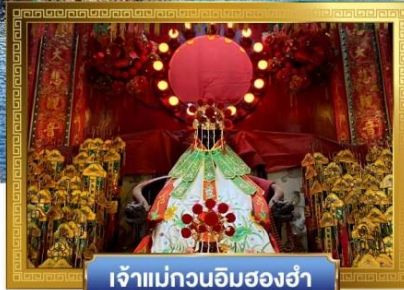
เจ้าแม่กวนอิมฮ่องฮ้า