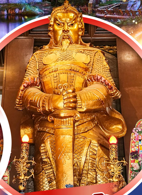
วัดเขกงหมิว