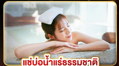
แช่น้ำแร่ธรรมชาติ