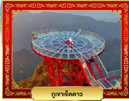
ภูเขাজิดดาว