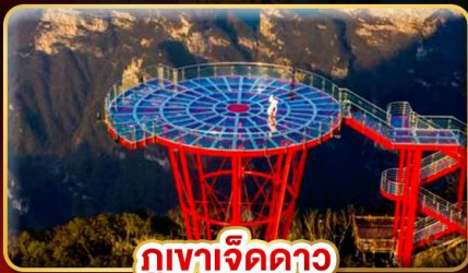
ภูเขาจิดดาว

สัมผัสเสน่ห์จางเจียเจีย มหัศจรรย์ทางธรรมชาติ