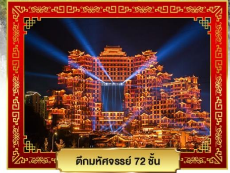
ตึกมหัศจรรย์ 72 ชั้น