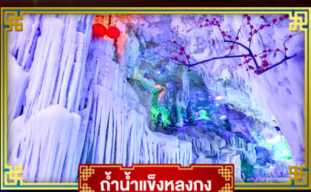
ถ้ำน้ำแข็งหลงกง

"เที่ยว 2 มณฑล กวางซี-กัชโจว" สุดอลังการ น้ำตก 2 พรมแดน แหล่งท่องเที่ยวระดับ 5A