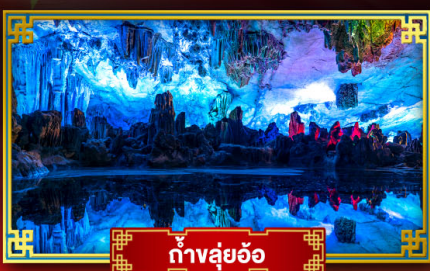
ถ้ำลุย้อ

"ดินแดนแห่งสายน้ำและขุนเขา" สัมผัสประสบการณ์นั่งบอลลูนชมวิวมุมสูง