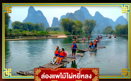
ล่องแพไม้ไผ่หยี่หลง