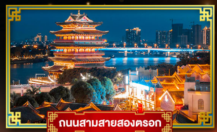
ถนนสามสายสองตรอก