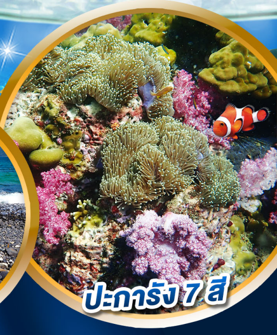
ปะการัง 7 สี