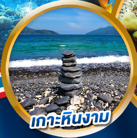
เกาะหินงาม