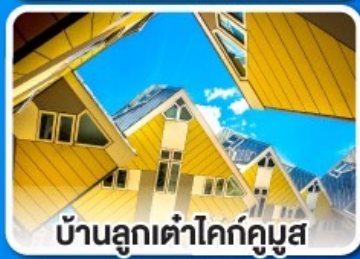
บ้านลูกเต่าโคกคูมูส