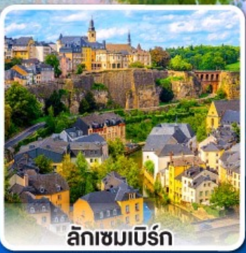
ลักเซมเบิร์ก

ล่องเรือ... ชมทัศนียภาพอันสวยงาม ตลอดสองฟากฝั่งของแม่น้ำโรน