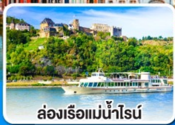
ล่องเรือแม่น้ำโรน