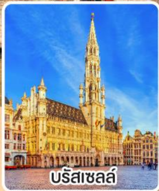
บรีซาเซลล์

พิเศษ เมนู หอยแอสคาโก้, งาหมูเยอรมัน หอยแมลงภู่อบไวน์ขาว