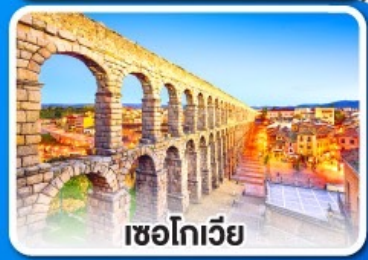
เซโกเวีย