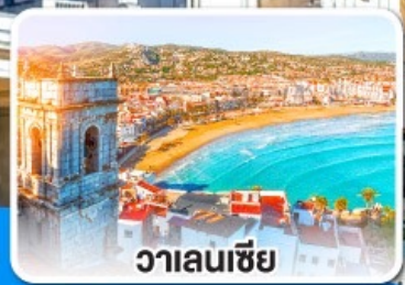
วาเลนเซีย