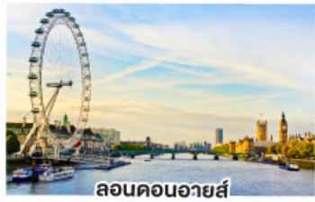
ลอนดอนอายส์