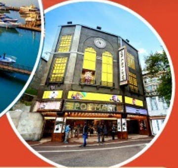
ร้าน POP MART ใหญ่ที่สุดในไต้หวัน