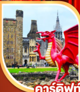
คาร์ดิฟฟ์