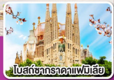
โบสถ์ซากราตาแฟมิเลีย