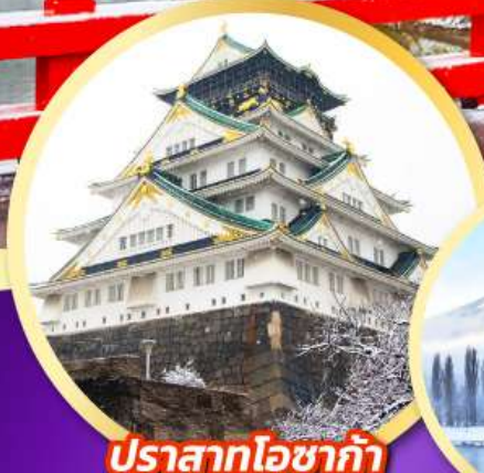
ปราสาทโอซาก้า