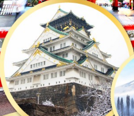
ปราสาทโอซาก้า