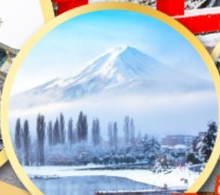
ทะเลสาบคาวากุจิโกะ