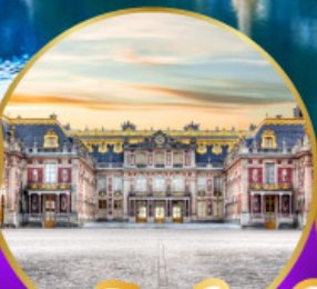
พระราชวังแวร์ซายส์