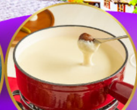
ฟองดูซึส