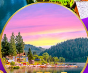
ททิเซ่ ปาดำ