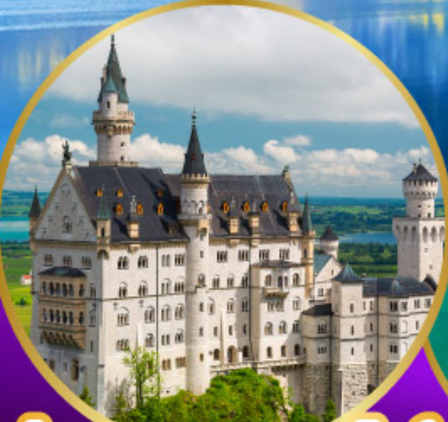
ปราสาทนอยชวานสไตน์