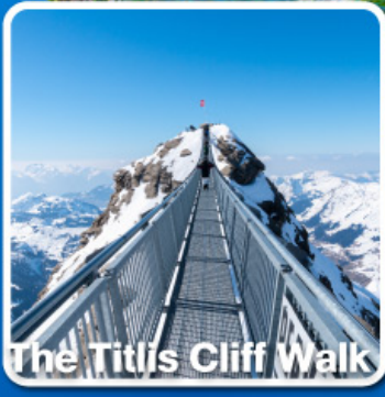
The Titlis Cliff Walk