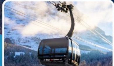
กระเช้า ไอเกอร์เอ็กสเพรส สู่จุงเฟรา

อิตาลี สวิตเซอร์แลนด์ ฝรั่งเศส 10 วัน 7 คืน