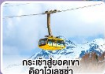
กระเช้าสู่ยอดเขาดืออาไวเลซซา