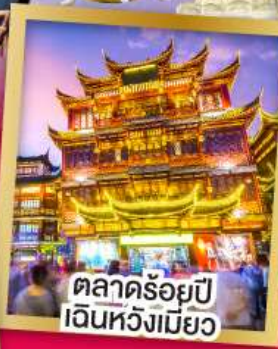
ตลาดร้อยปี เงินหั่งเมี่ยว