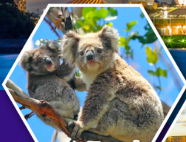
ชมหมีโคอาล่า ณ สวนสัตว์ซิดนีย์