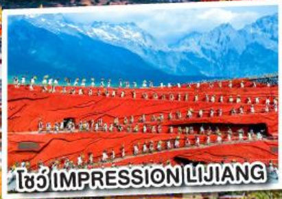
โซว์ IMPRESSION LIJIANG