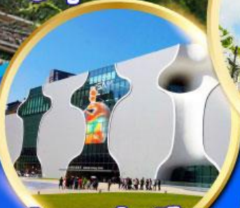
โรงละครแห่งชาติไทจง