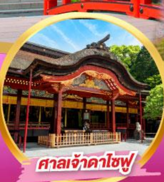
ศาลเจ้าดาไซฟุ