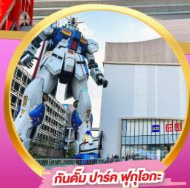
กันดั้ม ปาร์ค ฟุกุโอกะ