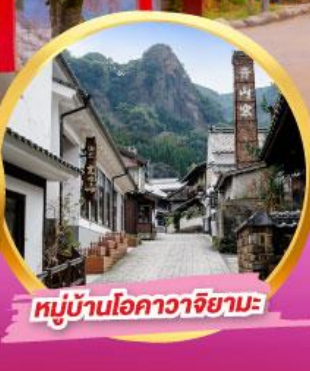
หมู่บ้านโอคาวาจิยามะ