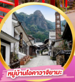
หมู่บ้านโอคาวาจิยามะ