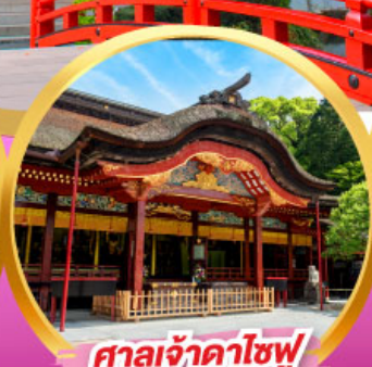
ศาลเจ้าคาโซฟู