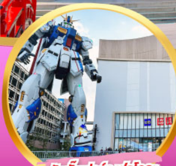
กันดั้ม ปาร์ค ฟุกุโอกะ

สัมผัสความโรแมนติก ชมซากุระในคิอูซุ พักออนเซ็น 1 คืนพร้อมอาหารเช้า อิสระท่องเที่ยว 1 วันเต็มในฟุกุโอกะ