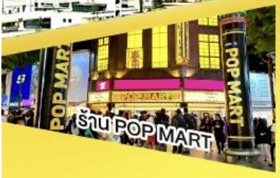
ร้าน POP MART