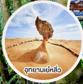
อุทยานเย่หลิว