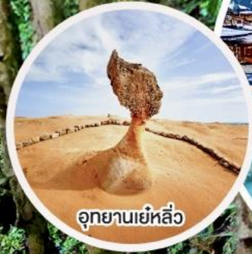
อุทยานเย่หลิว