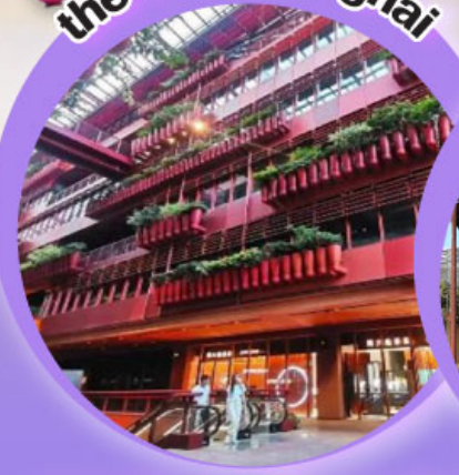
the roof shanghai