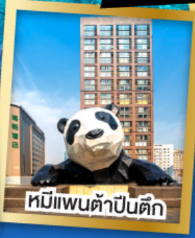
หมีแพนด้าปิ่นตึก