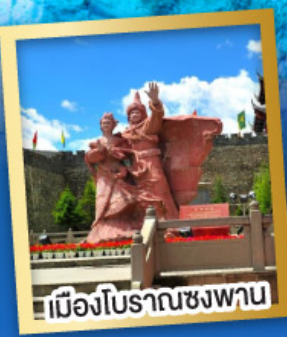
เมืองโบราณชงพาน