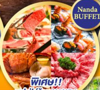
พิเศษ!! บุฟเฟ่ต์ร้าน NANDA ดีที่สุดในซัปโปโร