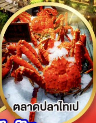
ตลาดปลาไทเป