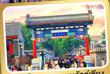
ถนนโบราณหนานหลวู่เกี๋ยง