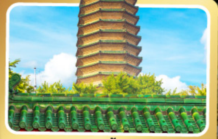
วัดพระเจี๊ยะท้าว