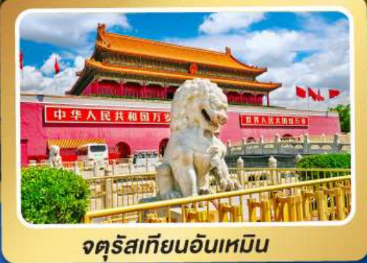
จัตุรัสเทียนอันเหมิน