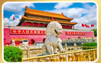
จัตุรัสเทียนอันเหมิน