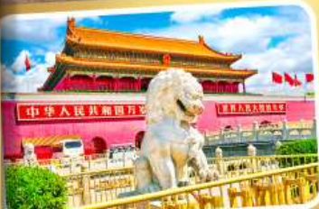
จตุรัสเทียนอันเหมิน