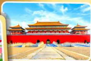
พระราชวังต้องห้าม