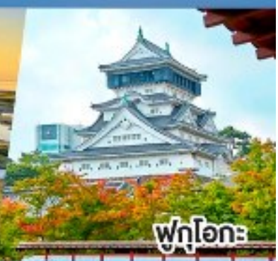
ฟุกุโอกะ