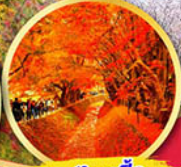
อุโมงค์ใบเมเปิ้ล โมมิจิ ไคโร