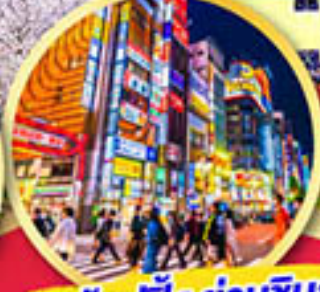
ช้อปปิ้ง ย่านชินจูกุ

พักออนเซ็น 1 คืน , พักโตเกียว 2 คืน บินเข้านาโกย่า-ออกโตเกียว