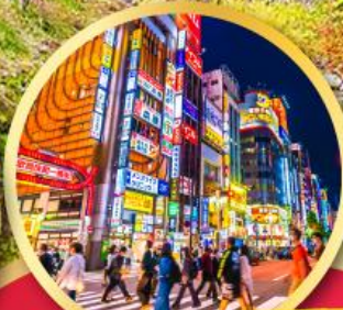
ช้อปปิ้ง ย่านชินจูกุ