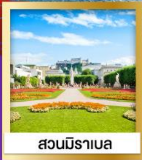
สวนมิราเบล