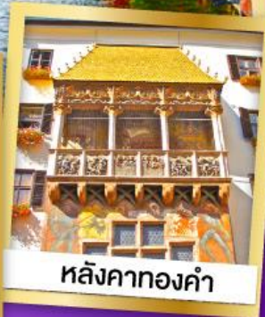
หลังคาทองคำ