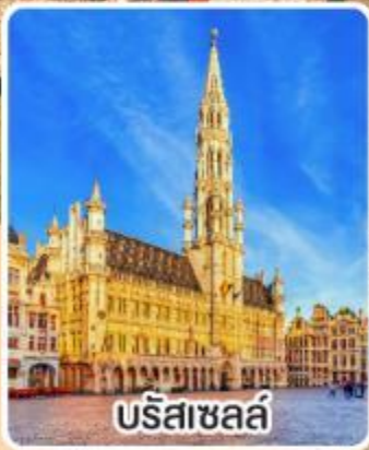
บริสเซลส์

พิเศษ!! เมนู หอยแอสคาโก้, จากหมู่บ้าน หอยแมลงภู่บไวน์ขาว