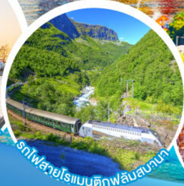
รถไฟสายโรแมนติกฟลัมสบานา