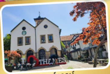
เทมส์ทาวน์