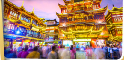
ตลาดร้อยปีเจียงหวงเมี่ยว

สนุกสนานไปกับเครื่องเล่น Shanghai Disneyland เต็มวัน