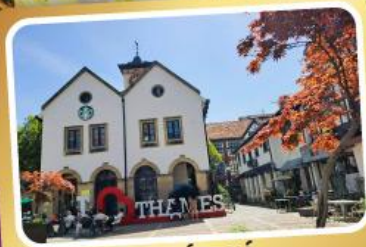
เทมส์ทาวน์