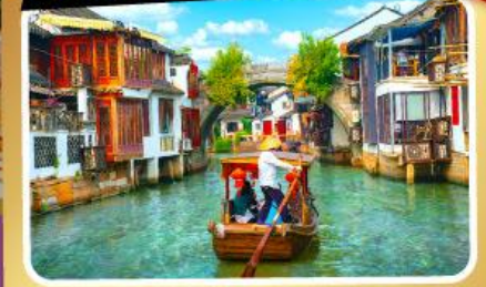
เมืองโบราณจูเจียเจียว