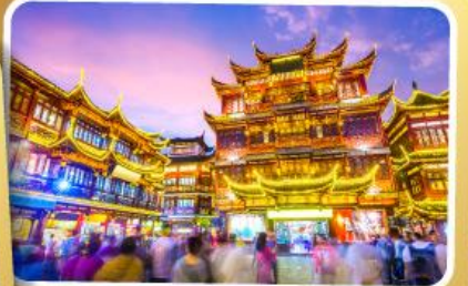
ตลาดร้อยปีฉางหวงเหมียว

สนุกสุดมันส์ไปกับเครื่องเล่น Shanghai Disneyland เต็มวัน