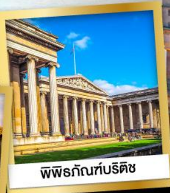
พิพิธภัณฑ์บริติช