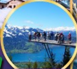
ยอดเขา ฮาร์นเคอร์คูลุม