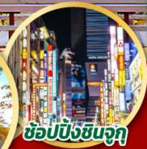
ช้อปปิ้งชินจูกุ