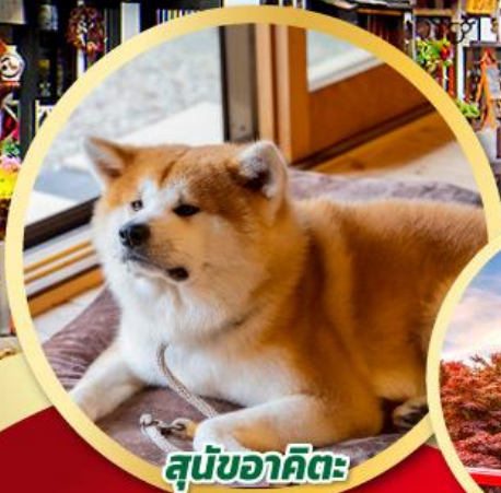
สุนัขอากิตะ