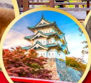
ปราสาทอิโรซากิ