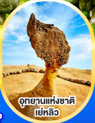
อุทยานแห่งชาติ เย่หลิว