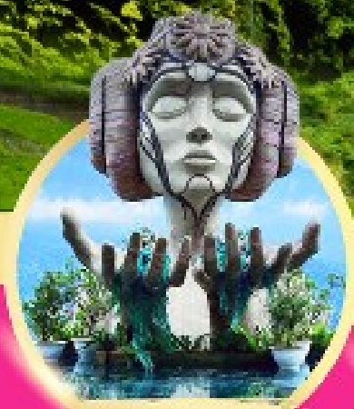
โมอาน่า ซาปา คาเฟ่