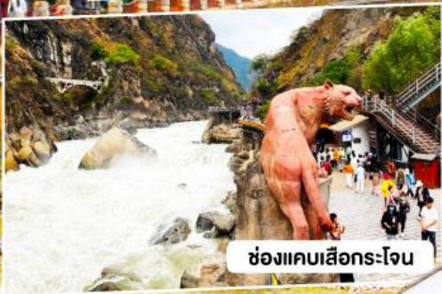
ช่องแคบเสือกระโจน