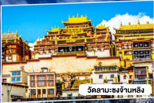
วัดลามะชงจ้านหลิง