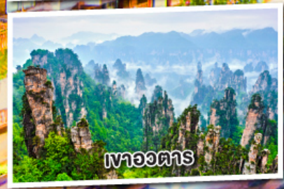
เขาอวตาร