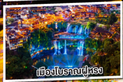
เมืองโบราณฝูหรง